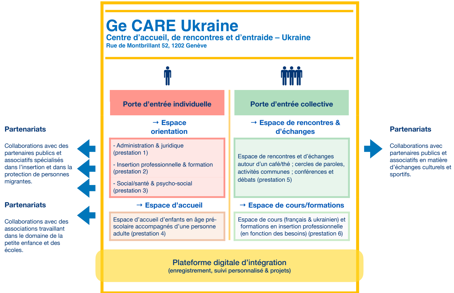
Schéma de fonctionnement Ge CARE Ukraine